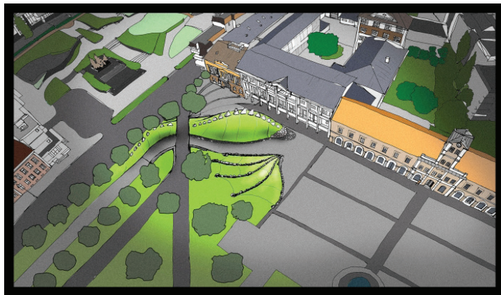
A sepsiszentgyörgyi főtér látványterve. Sepsiszentgyörgy polgármesteri hivatala jóvoltából

A tervezet a város főterének felújításához kapcsolódik. Sepsiszentgyörgy kettős, csak egy alacsony emelkedő által elválasztott főtérrel rendelkezik. E kettős térszerkezet kialakítása szintén a kommunizmus korszakára tehető. Mivel a város főterét az ott lévő történelmi épületek miatt nem lehetett teljességében felszámolni, a főtér szomszéd-